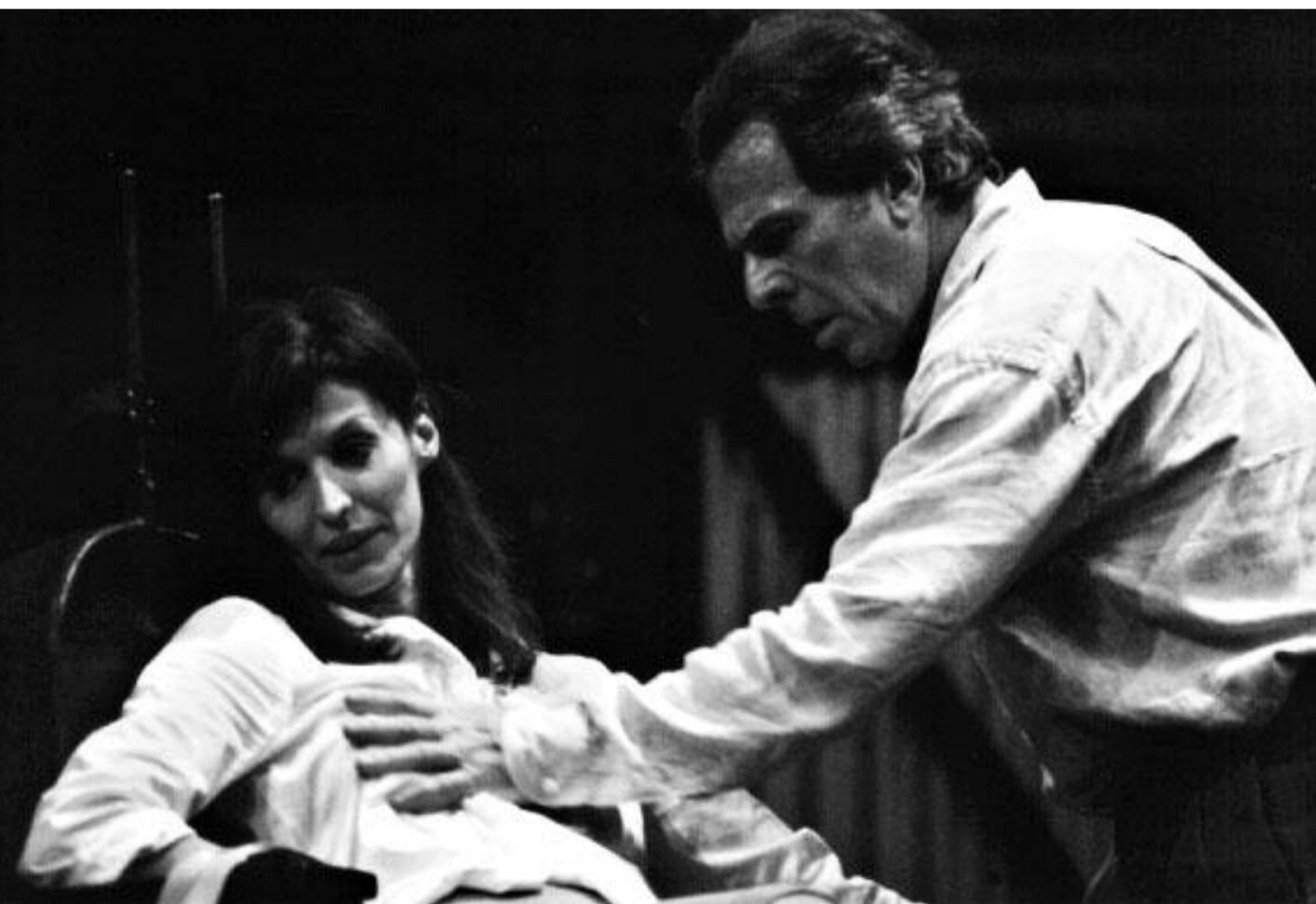
Esther Goris y Victor Laplace en un momento de la representación.