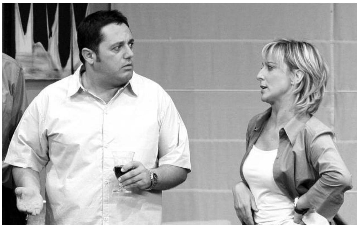
Pepón Nieto y Ana Labordeta

¡Excusas! es una comedia que refleja las dudas y miedos de las parejas en la actualidad, al afrontar los problemas que se les plantean al llegar a la madurez.