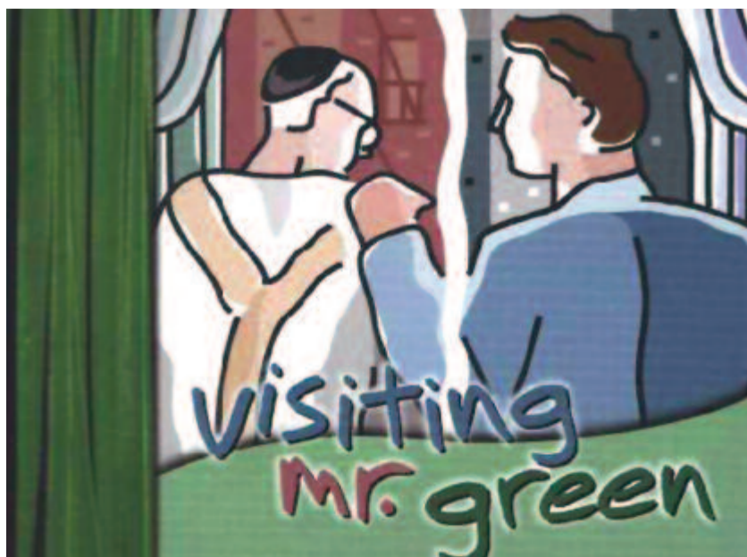
Imagen de la versión norteamericana de la obra.

magníficamente pauta entre los tramos cómicos y los trágicos –y en aquellos en que ambos géneros se solapan– hacia una posibilidad real de florecimiento, de apertura, de reunión generacional y de recomposición del círculo de afectos y sentimientos en cuyo seno podemos mantenernos vivos y expectantes, siempre que tengamos la valentía de vivir.