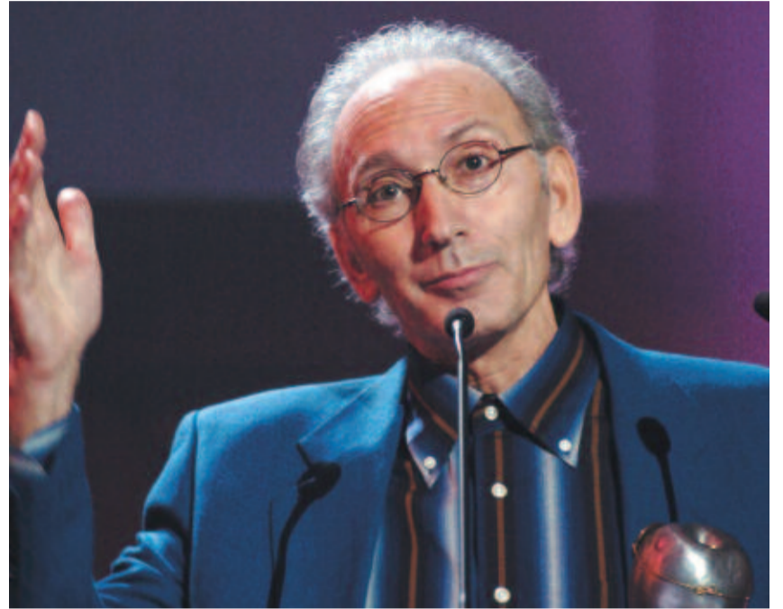
José Luis Alonso de Santos

Yo, Claudio ya partía como espectáculo favorito entre los nominados. Acaparaba el mayor número de nominaciones, siete