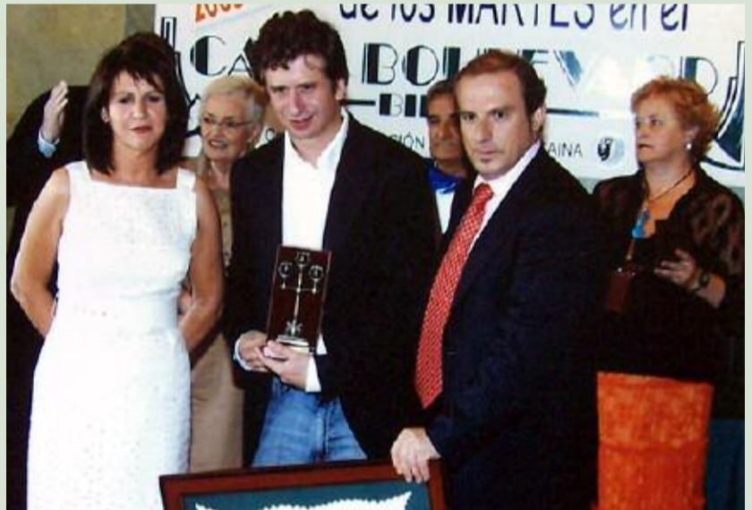
El actor, recibiendo el galardón "Acróstico".