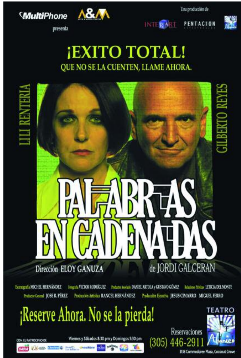
Cartel de la coproducción en Miami de Palabras encadenadas .