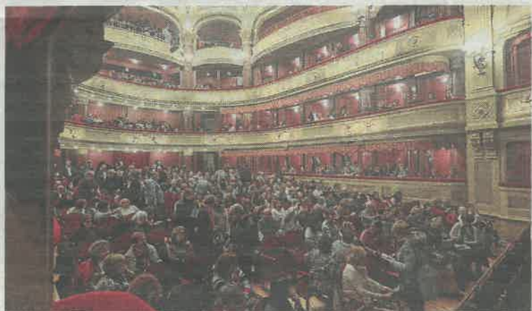
El público abarrotó el teatro avilesino para el estreno.